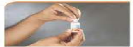
۴ - پاک کردن سر ویال