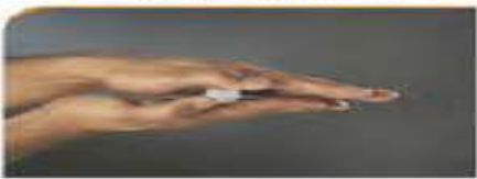
۳ - چرخاندن ویال بین دست ها