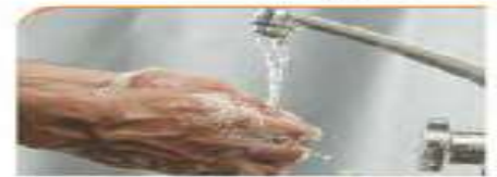
۱ - شستن دست ها