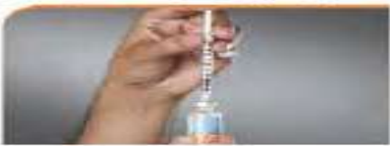
۶ - وارد کردن سرنگ داخل ویال