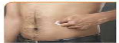
۱۰ - تمیز کردن محل تزریق