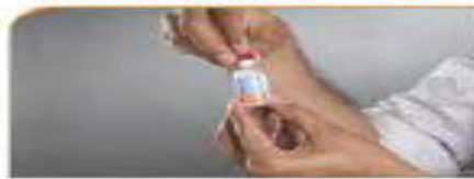
۲ - برداشتن درپوش پلاستیکی