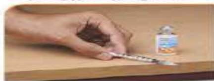
۸ - گذاشتن سرنگ روی میز