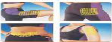
۹ - انتخاب محل تزریق