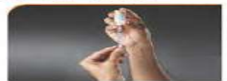
۷ - نگه داشتن ویال و کشیدن انسولین