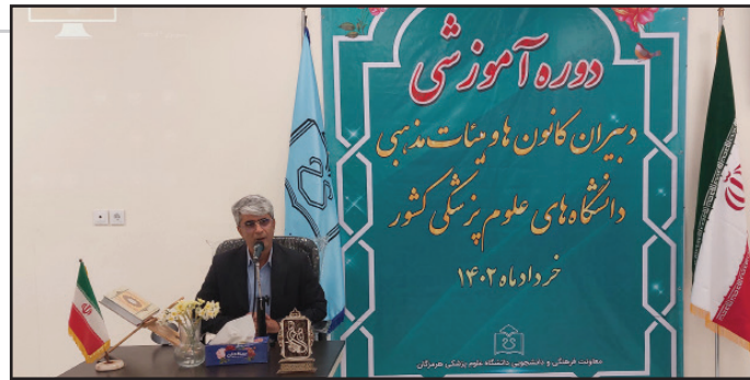
رئیس دانشگاه علوم پزشکی هرمزگان: